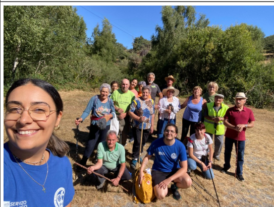
Caminata envejecimiento activo Centro de Salud de Chandrexa de Queixa