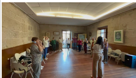
Talleres de prevención a la fragilidad Centro de Salud de O Carballiño