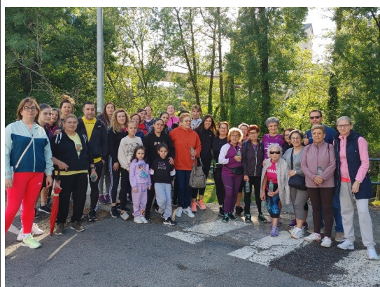
Primera caminata CS Allariz