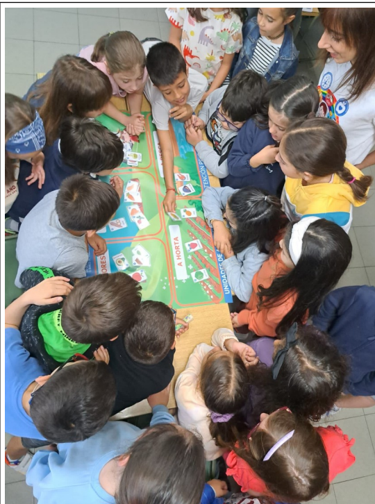
Taller de alimentación saludable en un colegio