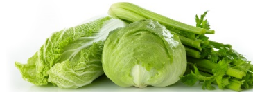
Verdura de hoja verde